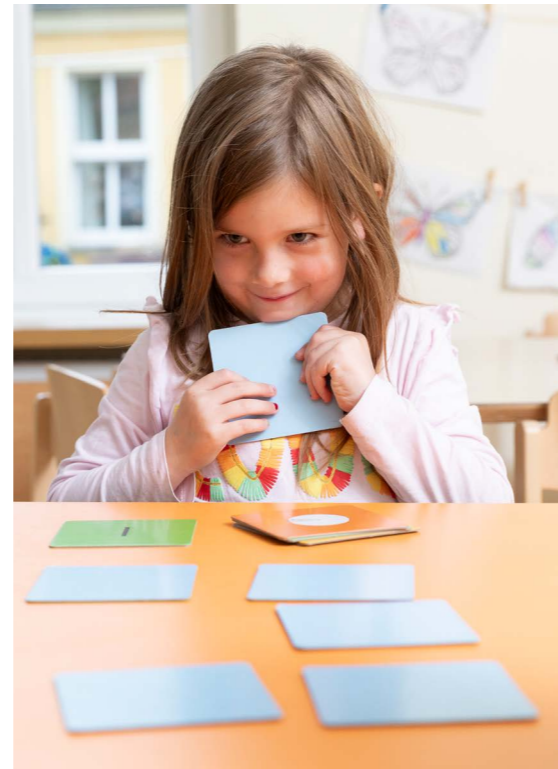
Das Zahlen-Memory erfordert hohe Konzentration.

Frühe Förderung ist essenziell, trotzdem kommt sie in Kindertagesstätten oft zu kurz. Mit Unterstützung der Postcode Lotterie hat das SOS-Kinderdorf Prignitz ein einzigartiges Bildungsprojekt initiiert.