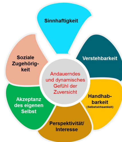
Abbildung 1: Dimensionen der Handlungsbefähigung

Paula empfindet es als beglückend und erfüllend, ihre Freizeit vielfältig zu gestalten und mit Freunden Zeit zu verbringen. All dies trägt zu ihrem Wohlbefinden und zu einem positiven Lebensgefühl bei.